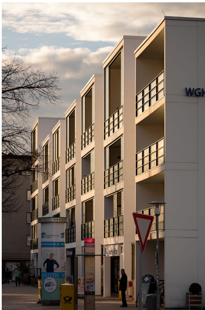
forum herrenhäuser markt 2.0