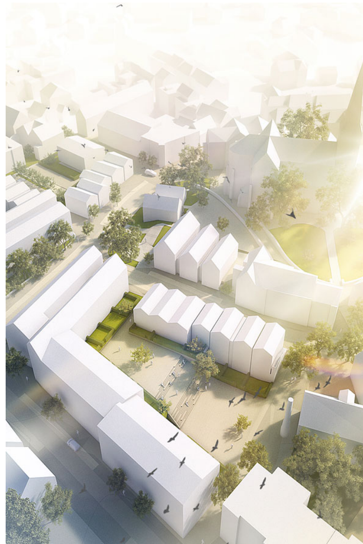
sankt jakobusquartier ennigerloh

das kostbare antlitz von ennigerloh, stadträumlich und topographisch entschieden geprägt durch die st. jakobuskirche und den die kirche umgebenden "drubbel" wird mit den baulichen interventionen des neuen st. jakobusquartieres den hüllblättern einer blüte gleich behutsam ergänzt. das neue quartier arrondiert dabei maßstäblich die stadtstruktur, würdigt signifikant die hierarchische silhouette der altstadt in anlehnung an den historischen stadtgrundriss und formuliert einen eindeutigen bezug zwischen dem quirligen merkantilen nutzungsgefüge auf dem rathausmarkt und der kontemplativen ruhigen milieu auf dem kirchhügel.