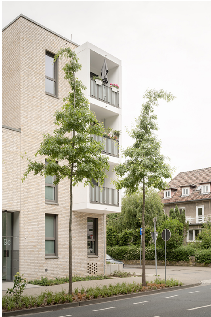
quartier am stadtpark

an der wohnstraße zwischen dem quartier und