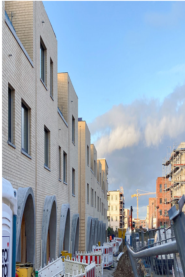
wohnen im bogen - kronsrode b.2

rücksprünge, fassadenrelief und vorkragende gesimse als dachrand harmonisieren bei hangigem gelände die hausspezifischen ansichten, bogenartig überspannte hauseingänge fokussieren den blick auf dieses wesentliche element des jeweiligen hauses und geben den geschosswohnbauten wie auch den reihenhäusern einen charakteristische, verbindende prägung. die abwechselnd zwei- bis dreigeschossig in erscheinung tretenden townhouses rhythmisieren