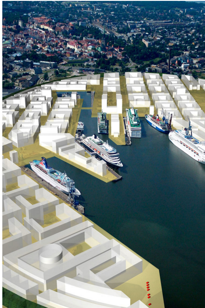
baltic bay city

die "baltic bay city" mit einem elliptischen grundriss setzt zu dem historischen stadtkern eine eigenständige ergänzung. ein grünzug begrenzt und verbindet beide stadtzentren.