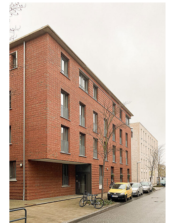
sankt leonhards garten

das mehrfamilienhaus an der bennemannstraße wurde mit einem mix unterschiedlicher wohnungsgrößen und -zuschnitten errichtet. die städtebauliche figur wurde im rahmen des wettbewerbs zur konvertierung des straßenbahndepots in braunschweig festgelegt. das gebäude bildet das entrée zum 'wohnen am sankt leonhards garten' in braunschweig.