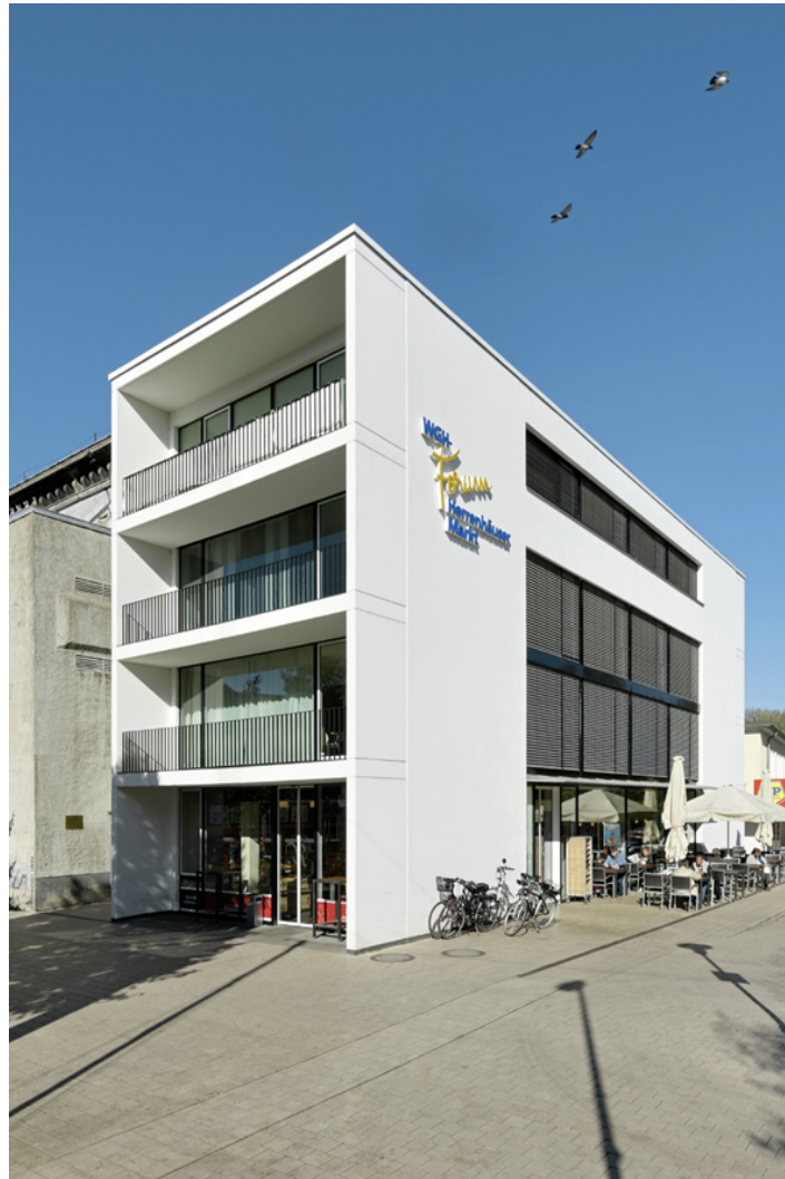
haus am markt