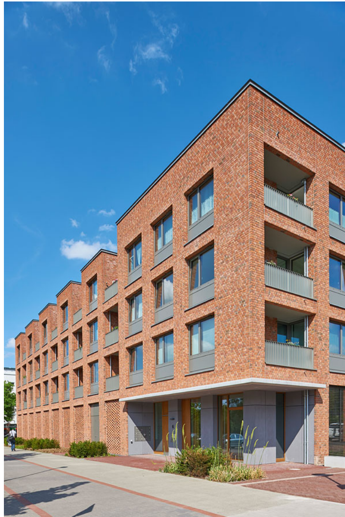
wohnen am thie

sieben appartements mit zugeschalteten duschbädern gruppieren sich um ein raumkontinuum aus entree, küche, wohn- und essraum mit vielfältigen ausblicken in das umgebende quartier und den garten. um den bewohnern ihren wohnraum so normal wie möglich zu gestalten, wurden die "dienenden räume" jeweils außerhalb der wohnung untergebracht. eine behindertengerecht ausgestattete "satellitenwohnung" in direkter anbindung an die