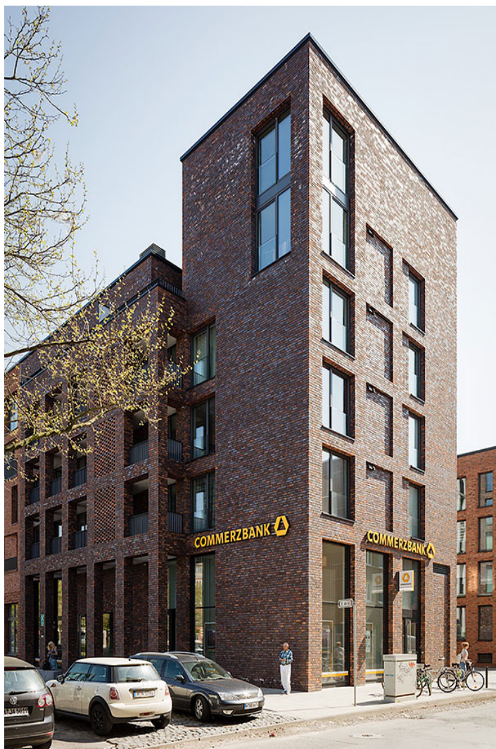
wohnen am klagesmarkt

die baulich-räumliche einhausung auf dem platz des klagesmarktes im sinne eines neuen stadtquartiers, thematisiert die reizvolle lagegunst verantwortungsvoll und eingängig, sowohl zugunsten der bewohner als auch für die gemeinschaft, gleichsam wie eine vertraute partitur des wohnens mitten in der stadt.