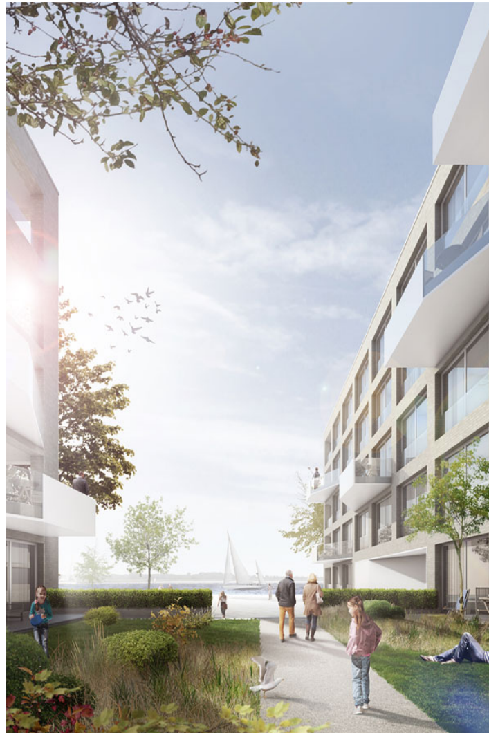
wohnen an der weserpromenade

bei der ausdifferenzierung des entwurfskonzeptes wurde in der grundrissgestaltung sorgsam darauf geachtet, keine "zweite wahl"-wohnungen entlang der sachsensteinstraße anzubieten - alle wohnungen