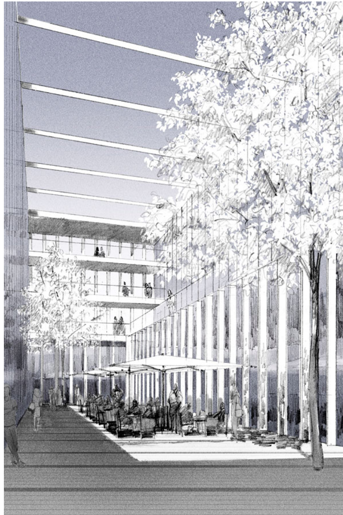
haus der begegnung

das kommunikationszentrum selbst gruppiert sich um ein atrium, das einmal abgesehen von kalten wintertagen als üppiger begegnungsraum genutzt werden kann, und öffnet sich auf der westseite zu einem in sich geschlossenen garten des rückzuges.